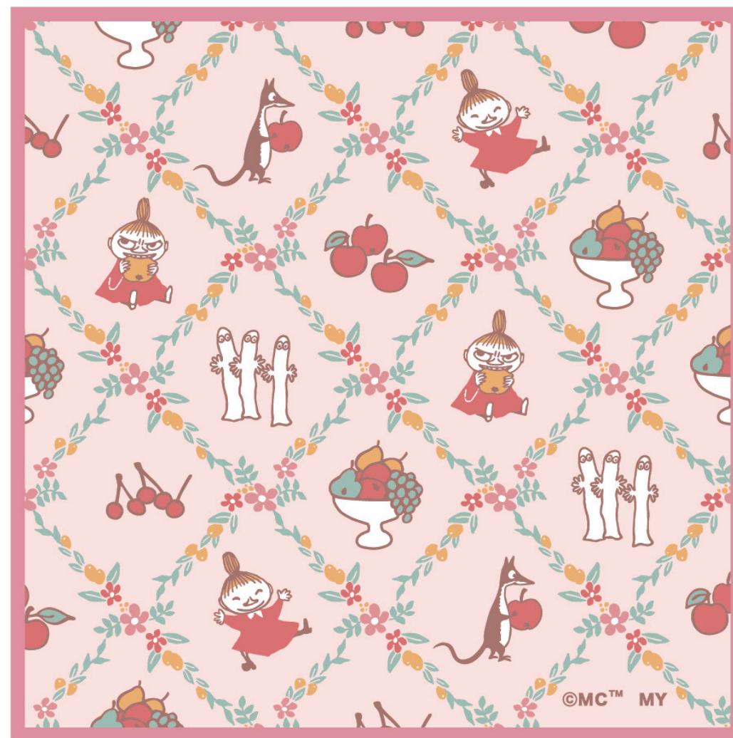
05837 クロス リトルミイ